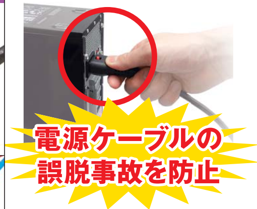
【冗長化電源ユニット接続例】